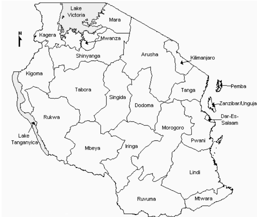
RUVUMA REGION MAP

Il progetto sarà realizzato in Tanzania nella provincia di Namtumbo, Regione Ruvuma, al confine con il Mozambico e con il Malawi, con sede principale presso il villaggio di Msindo , circa 50 km a Nord – Est di Songea (capoluogo di regione).